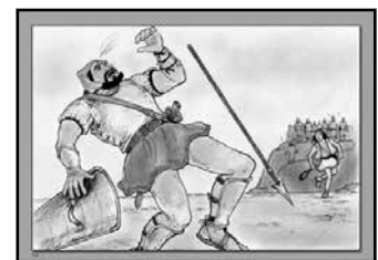
1 Царств 17:1 – 18:9.