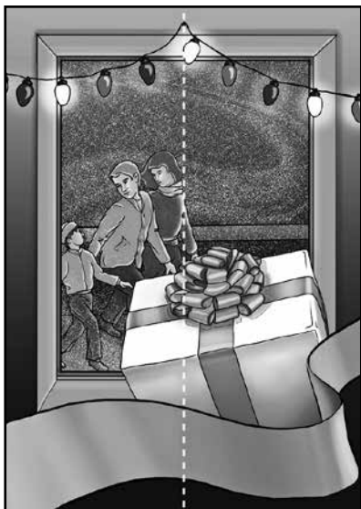
Pročitajte (ili neka dete pročita) stih iz vaše Biblije.

Iako pastiri nisu razumeli sve, otišli su u Vitlejem da vide Onoga o kome je anđeo govorio. Pronašli su Mariju i Josifa i bebu kako leži u jaslama. Bili su jako srećni zato što su videli Onoga koji je bio obećani pre tako mnogo godina. Slavili su Boga za sve šta su čuli i videli. Ovo je bio poseban trenutak za njih.