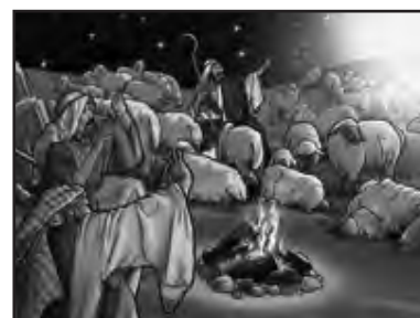
Un copil să citească mesajul îngerului (Luca 2:10-12).

„Numele Lui va fi Isus“, spusese îngerul. Dumnezeu le spusese să dea copilului acest nume special, Isus, pentru că „El va mântui pe poporul Lui de păcatele sale” (Matei 1:21). Dumnezeu a iubit pe oamenii ca tine și ca mine atât de mult, că a trimis pe singurul Lui