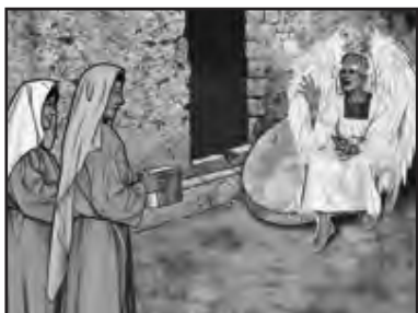
Cere copiilor să mimeze că ei sunt femeile care spun vestea.