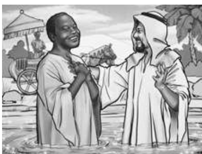
Citește versetul din Biblie.

Arată cartonul pe care e scris cuvântul „găsit”.