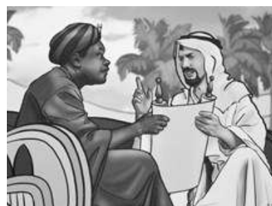
Arată adevărul central.