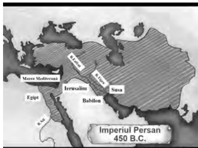
Arată Ierusalimul pe hartă.

Dumnezeu îl pregătea pe Neemia pentru o lucrare și mai importantă. Însă mai întâi de toate el trebuia să-și îndeplinească bine slujba la palat. Dumnezeu are un plan special și pentru viața ta. Primul lucru pe care Dumnezeu vrea să-l facă în viața ta este acela de a te salva din păcat, de a te mântui. Ca și oamenii din