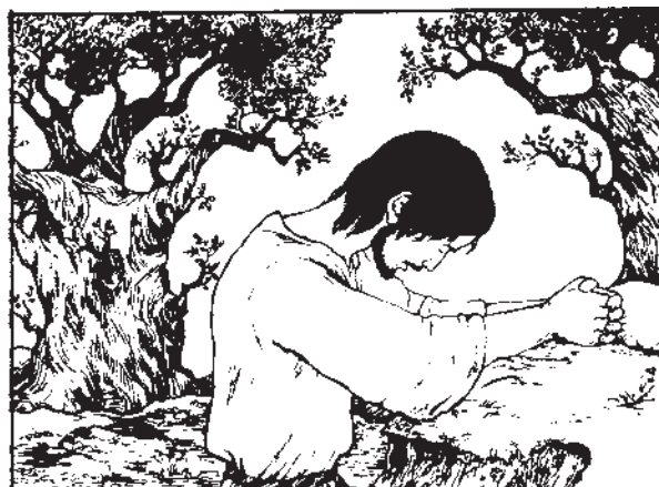
Исус Христос е вечен Свештеник