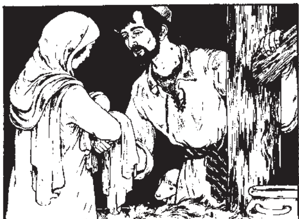
Синот Божји стана човек