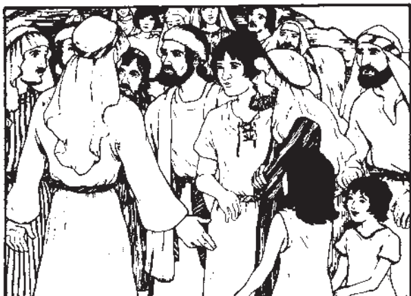
Господ Исус Христос- Учителот