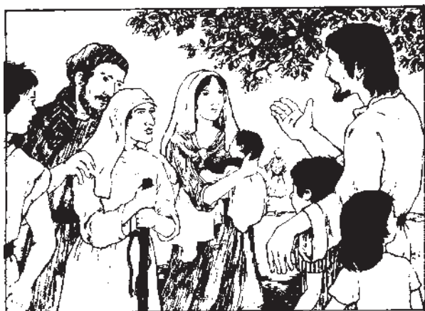
Господ Исус Христос е Бог Синот